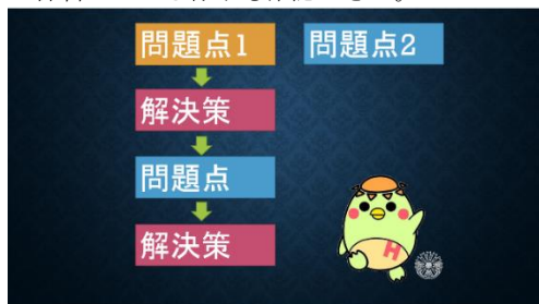
写真2 スライドの一部

り方」を加えるなど、生徒自身の視点で行う生徒総会が実現されているように感じた。またデジタル情報であるから編集も容易であり、各自のスマホにデータを落とし込んで練習している様子も確認できた。