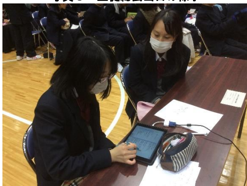
写真4 iPad をタッチペンで操作する役員