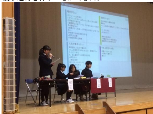
写真3 生徒総会当日の様子

PC と異なる iPad のメリットは生徒たちが普段から使い慣れているフリック入力を活用できる点にもある。又、こちらの指示を待つことなく音声入力やタッチペンによる入力を自分たちで自然と試みており、従来の PC 教室での一斉指導を超えたものとなった。加えて、ピンチによるズームイン&ズームアウトは文字の視認性を高め、動的なコンテンツとして興味を促す。又、書記だけでなく司会、タイムキーパーがそれぞれ iPad を所持し、無線 LAN 環境で用いることで画面の共有を行った。この結果、3者で綿密に連絡を取ることができ、効率の良い議事進行を行うことができた。