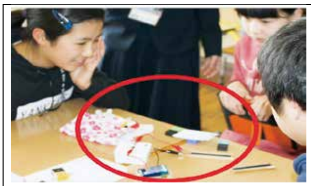
写真1 話し合いの場面

そして、作成したシステムをポスターツアー形式で発表し、論点を「電気を効率よく利用する」に絞って話し合いを行った。論点を決めることで、理科の目標からぶれずに話し合いを進めることができていた(写真1)。