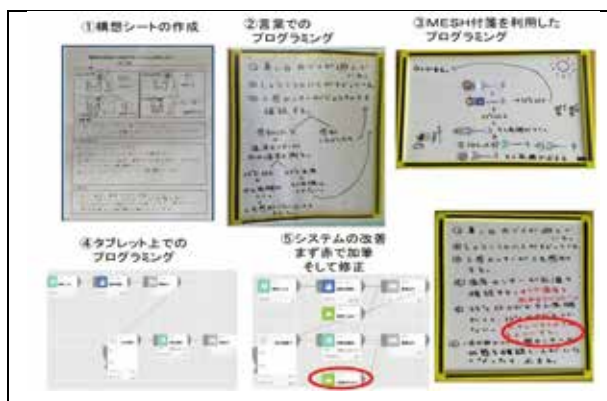
図2 5つのスモールステップ