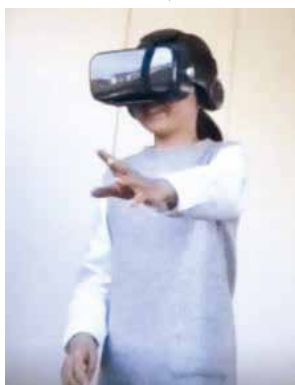
写真1 本人だけの「VRの世界」

「VR コンテンツ」を活用することで、①オンライン (自宅にいながら) でも、運動量の他にも資質・能力を育む体育が可能になる。②HMD (VR ゴーグル) とスマートフォンがあれば、VR コンテンツを視聴することも、VR を活用したオンライン授業もでき、自宅が教育の場となる (写真1)。③再び感染症拡大防止対策など同様の事態が起きても、学び続けることができる。本実践で扱うのは、体づくり運動領域の「平均台」を教材とするコンテンツである。平均台がある家庭はほとんどな