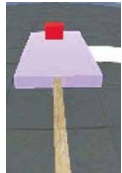
写真2 VR (平均台)

また、VR を活用することで、学びのスタイルが変容すると考えた。VR の特徴として、写真や映像で見ると、自分がその空間にいるような没入感を味わうことができる。友達と比較したり、外部資料から自分の技能を捉えたりするのではなく、自分だけが味わっている「動きの感じ」を大切にしながら、目指す到達点に向けて課題探求する。教師が示した学習内容ではなく、自分で決めた目的地を目指して進んでいく。教師の役割は、「ティーチャー」ではなく、「ファシリテーター」もしくは「コーチ」であるだろう。VR コンテンツを活用することによって、教師が設定した視点ではなく、子ども本人の視点から学習教材を見つめ、より意欲的に活動に取り組む体育学習になるように計画した。