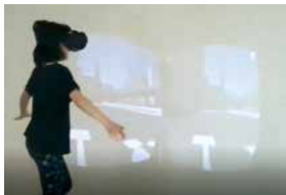
写真3 VR平均台を渡ろう！

前時を経て、教師と子ども、子どもと子どもとの関係が少しずつ築かれたように感じた。体ほぐしの「忍者手裏剣」では、心がほぐれているためか、前回よりも素早く動いたり、高くジャンプしたりする子が見られた。次に、教師が見付けた様々な渡り方を紹介し、いろいろな渡り方があることに目を向けた。子どもたちは、ジャンプしたり、片足ケンケン、両手を斜め上に挙げながらリズムに乗ったりなどの遊び方の工夫を見せてくれた。グループで自分の気付きや動きのコツを共有する時間では、「〇ちゃんが言っていた前を見ることや、たまに下を見て確認することを試してみたらうまく渡れました」(5年生)と、子ども