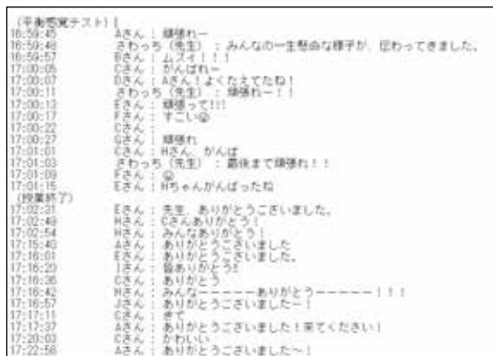
写真4 感覚チェック時チャット及び授業後チャット

本時の子どもたちの思考は、今まで以上に柔軟だった。共有した友達の動きをやってみたり、動きを組み合わせたりするなど動きの工夫が多く見られた。夢中になって取り組む中で、確実に動きの質も高まっていると感じた。最後のふり返りでは、「VR体育に参加して、1日目は知らない人もいるし緊張したけど、2、3日目になると楽