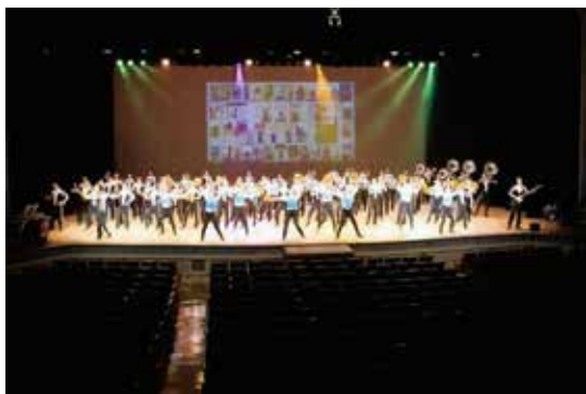
写真2 卒業生の遠隔演奏と在校生の共演

5月11日以降、本県で2回目の休校が部分的に解除されてからは、定期演奏会の会場である諫早文化会館大ホール（長崎県諫早市）を使用して全部員が演奏・演技で参加する無観客の特別演奏会を YouTube 上でライブ配信することを計画し、6月7日に実行した。当日の撮影や配信作業は、これまで定期演奏会の記録 DVD を作成している業者（株式会社ミチプロ・宮崎市）に依頼して複数のカメラを切り替えることで、ステージ上で複雑な動きを伴うマーチングなどは臨場感ある映像を配信できた（ネット接続はモバイルルーター使用）。また、この演奏会の最後に行った「You can't stop the beat」の共演（写真2）のため事前に卒業生の遠隔演奏動画を作成する際は、在校生の遠隔演奏の経験から参加する卒業生（39名）に基準用動画を送信し、各自の演奏を撮影してもらうことでスムーズに演奏動画の統合ができた。さらに、演奏会で卒業生の遠隔演奏動画と在校生の生演奏を実際に共演するにあたっては、リハーサルで2つの演奏の音のバランスを何度も確認するとともに、諫早文化会館に依頼して演奏の一体感を決めるカギとなるドラムセット担当の部員の横にモニター用の大型スピーカーを別途設置し、遠隔演奏の音を聴きやすくした。