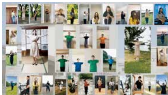
写真1 卒業生の遠隔演奏

習の成果を発表する機会を部員に与えるとともに、来場できないお客様に部員の演奏・演技の姿を届けることを目的および目標とした。また、2回目の休校期間後に吹奏楽コンクールなどの各種大会の中止が発表され、大きな目標を失った吹奏楽部員のモチベーションを維持することも目的とした。さらに、この演奏会の目玉の1つとして吹奏楽部卒業生の遠隔演奏動画(写真1)を会場に流し、在校生部員の生演奏と共演するという取り組みを行い、卒業後の時間と現在の生活場所という世代・空間を越えて演奏会に参加し、卒業生と在校生の絆を深める機会とした。