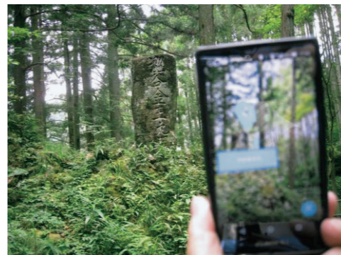
写真2 「マチアルキ」利用場面

子どもたちが訪れた昔話の場所を地点登録しておくことで、その場所で、「マチアルキ」アプリをインストールしたスマホやタブレットなどをかざすことで、登録して