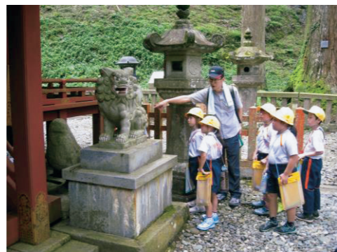
写真1 鳳来寺山での「ふるさとたんけん」